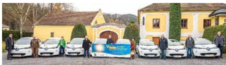
e-Car Sharing

Zentrales Element jeder Modellregion ist ein Modellregionsmanager. Gemeinsam mit Partnern aus der Region werden Projekte in folgenden Bereichen umgesetzt.