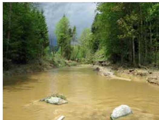
Unwetter Grohdorf

Für nähere Informationen zu den Themen der KLAR! Bucklige Welt - Wechselland erreichen Sie Mag. (FH) Rainer Leitner unter 02643 70 10 20 bzw. im Internet unter http://www.buckligewelt.at/klar